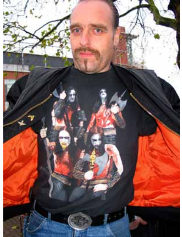
Zine, forside, Arnhem Meeting, eget projekt.

Vær åben, fleksibel og tålmodig. Tal med andre som har stået i den samme situation, som du står i lige nu.